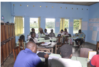
Commission Afrique au Cameroun

La Fédération Internationale des Ceméa, dans le cadre de l'animation de son réseau, a organisé au cours de l'année 2018, quatre rencontres de commissions régionales. La commission Afrique s'est tenue au Cameroun en août, en septembre aux Seychelles pour l'Océan Indien, en novembre à Toulouse pour l'Europe et pour finir en octobre en Uruguay pour la commission Amérique Latine et Caraïbes.