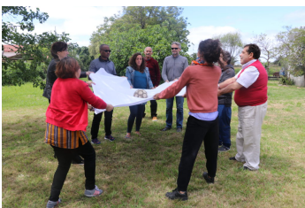
Commission Amérique Latine et Caraïbes