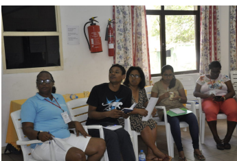
Commission de l'Océan indien aux Seychelles