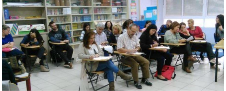
Sesión de trabajo con la comunidad educativa de Villaverde

Projet Villaverde: pour une éducation à la citoyenneté mondiale