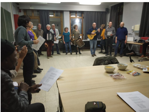
Groupe Vocal "C'est des Canailles !"

Nous vous invitons à suivre de près les projets de la FICEMEA, qui fait peau neuve, qui développe tant de projets communs aujourd'hui et est bien déterminée à continuer demain !