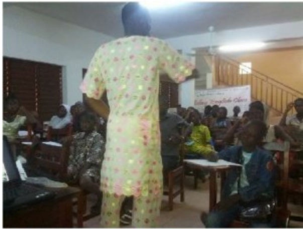
Image 4: Explication de cours par l'un des formateurs du laboratoire de langues du CAEB.