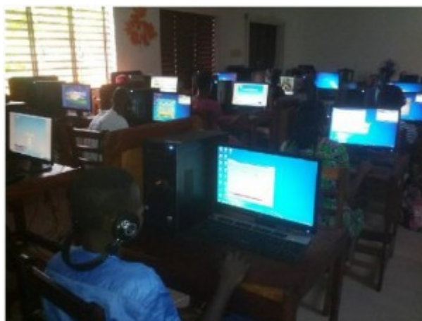
Image 2: Démarrage du H.E.C. Cours-Jeux- Apprentissage interactif dans la salle Obama du Laboratoire de langue du CAEB.