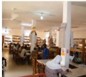
Bibliothèque du CAEB à PARAKOU