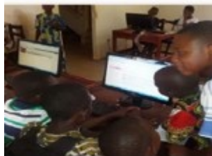
Les internautes en travaux d'exposé dans le cyber du CAEB