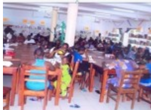
Consultation sur place dans la bibliothèque de Porto-Novo I