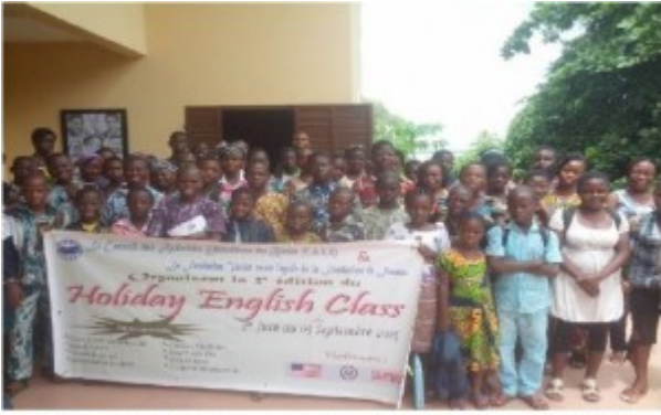
Image 6: Photo de famille après les cours du matin au laboratoire de langues du CAEB dans le cadre des activités du HEC2015