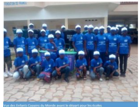
Vue des Enfants Copains du Monde avant le départ pour les écoles

Les enfants Copains du Monde ont bénéficié de deux formations. L'une sur les droits des enfants et sur les techniques élémentaires de sensibilisation et de prise de parole en public et l'autre sur le maintien d'un environnement sain et les principes d'une alimentation équilibrée.