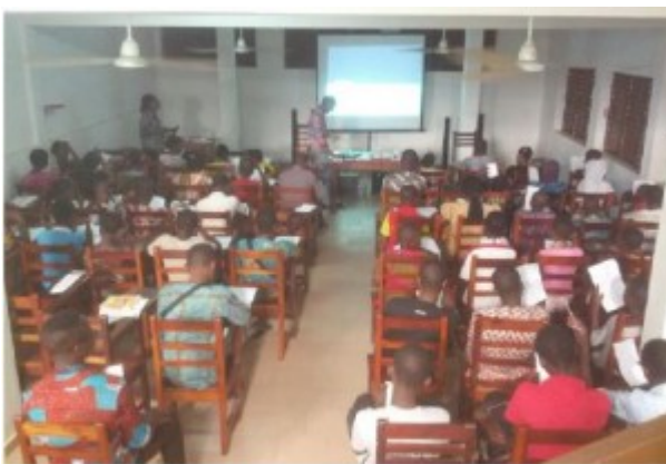
Image 1: Projection de film suivi de commentaire dans le cadre des activités du HEC2015

Il s'agit des prix HEC 2015 pour 3 des apprenants les plus studieux et les plus anciens du laboratoire de langues du CAEB.