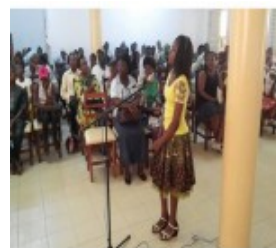
Phase finale du concours Spelling Bee organisé par le ressort de langues du CAEB