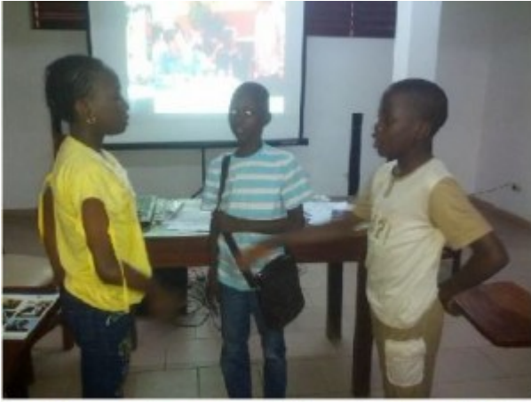
Image 3: Cours pratique au sous sol du laboratoire de langue du CAEB dans le cadre des activités du HEC2015