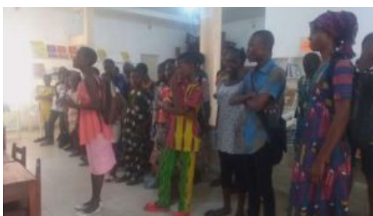
Photos des séances de préparation avant les sensibilisations

Quatre séances de préparations des sensibilisations ont été réalisées avec les enfants et ont permis d'une part aux enfants d'évaluer leur propre niveau et d'autre part aux encadreurs de revoir certains points pour un meilleur déroulement des